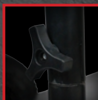
Poignée facile à assembler