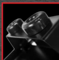
Support frontal redessiné