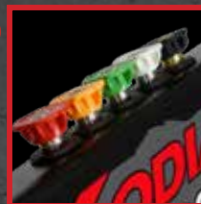
5 Buses de lavage