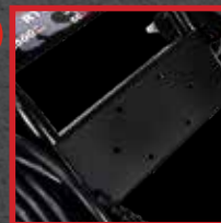
Plaque pour dévidoir