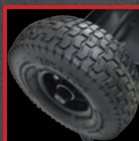
Pneu de 10" gonflé